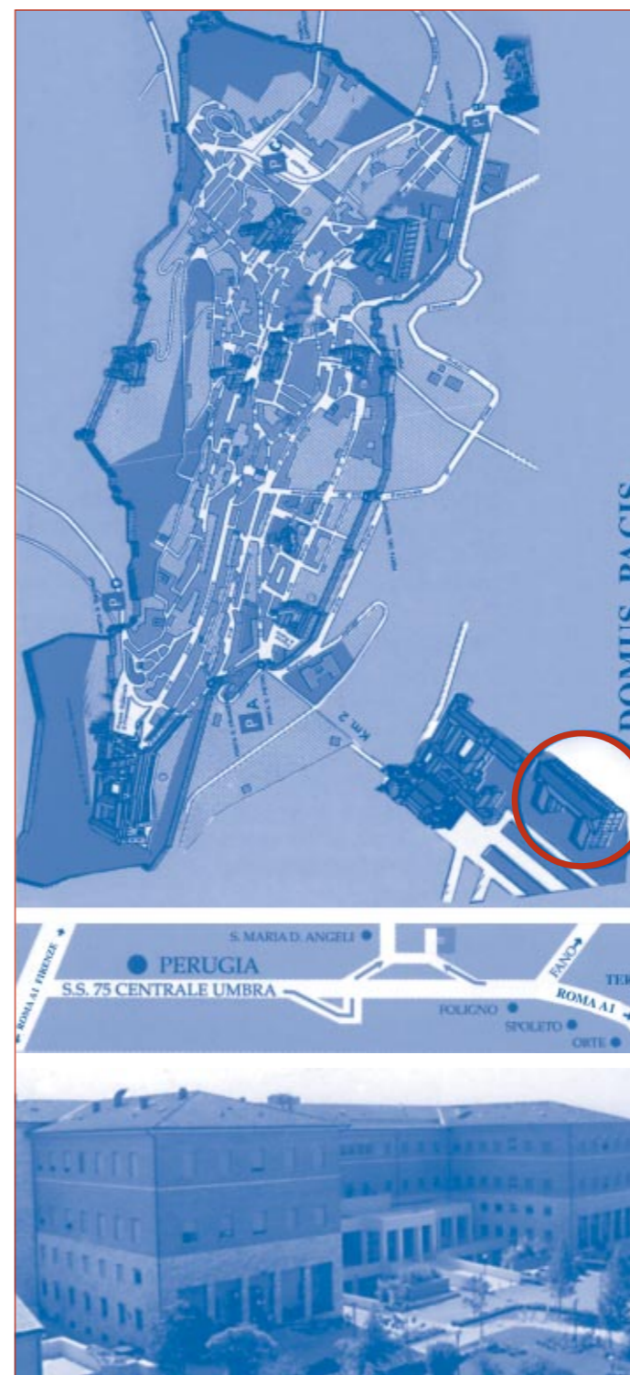
ARTI GRAFICHE ANTICA PORZIUNCOLA – CANNARA (Pg)